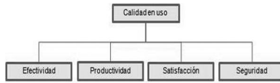
Figura # 3: Modelo para evaluar la calidad de uso (perspectiva de usuarios).